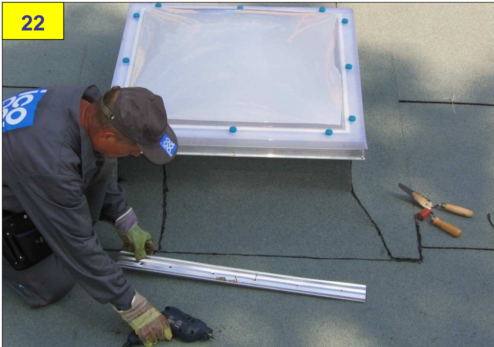
Montaż listwy dociskowej