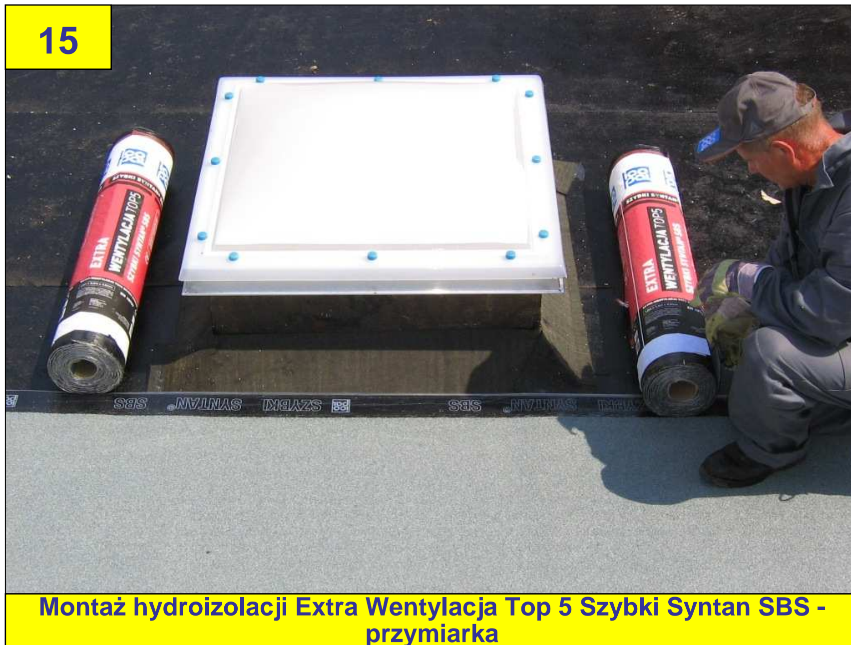
Montaż hydroizolacji Extra Wentylacja Top 5 Szybki Syntan SBS - przymiarka